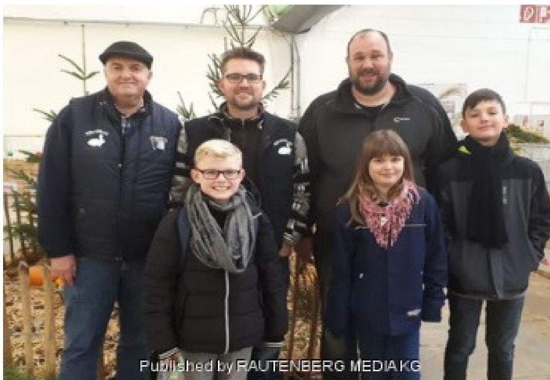
Published by RAUTENBERG MEDIA KG

Kaninchenzuchtverein R10 Schlich/D'horn/Merode erfolgreichster Verein der Landesverbandsausstellung